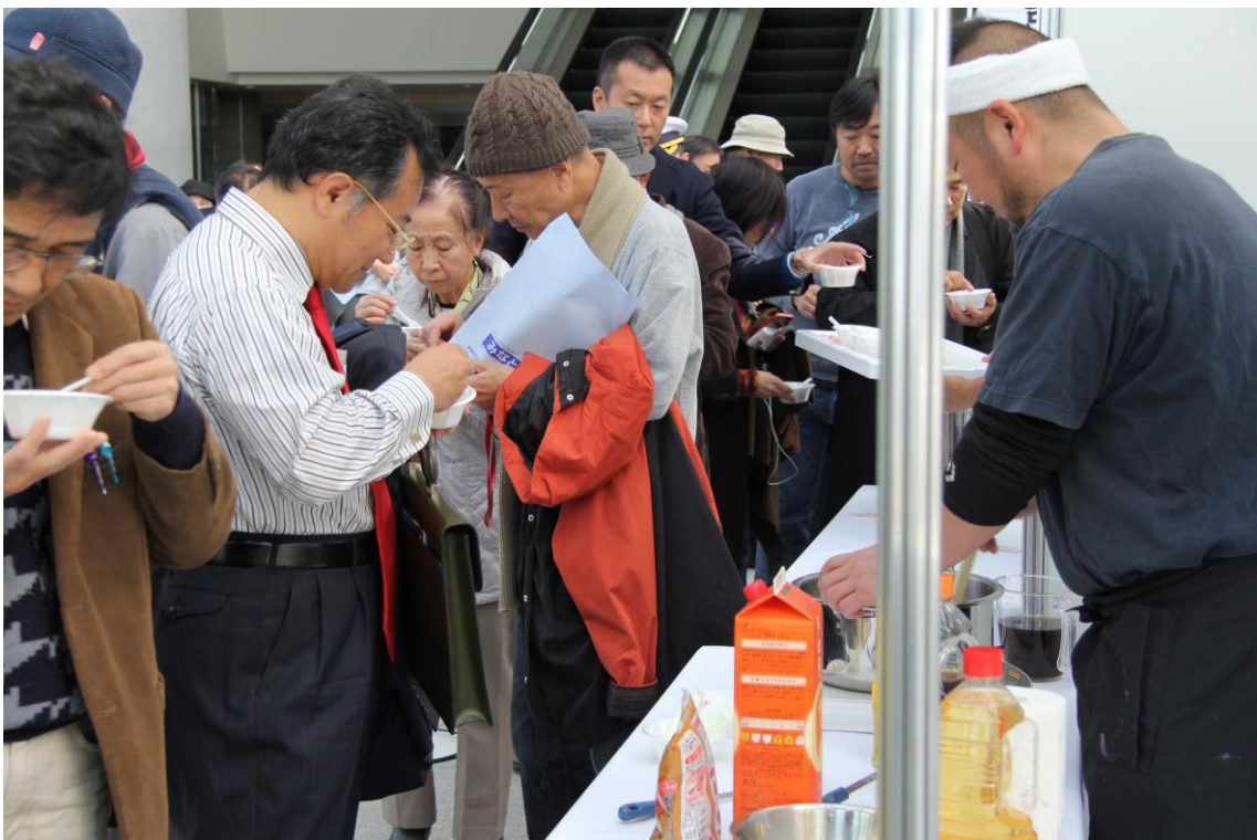
漁師の家庭に伝わる調理法による江戸前の味「アサリ豆腐」の試食