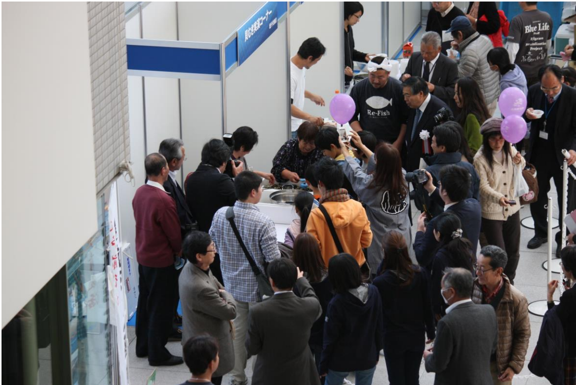
アトリウム右での江戸前水産物の展示・試食・販売の様子