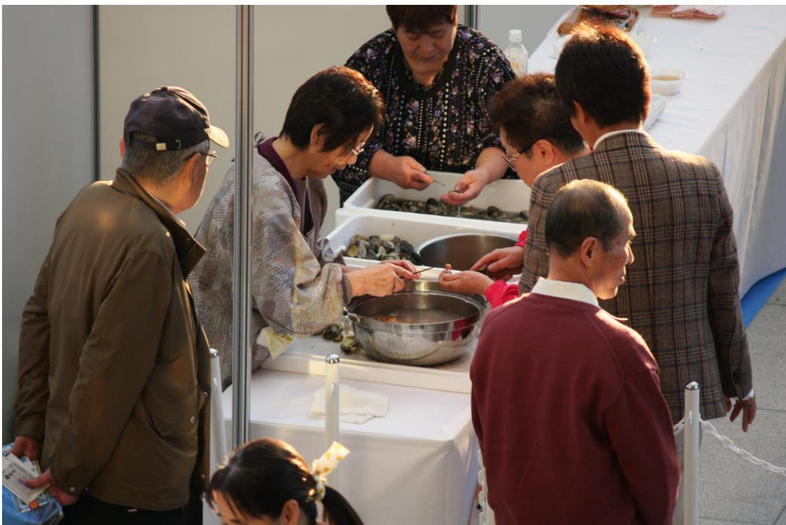
浦安の皆さんによるアサリの貝むき実演