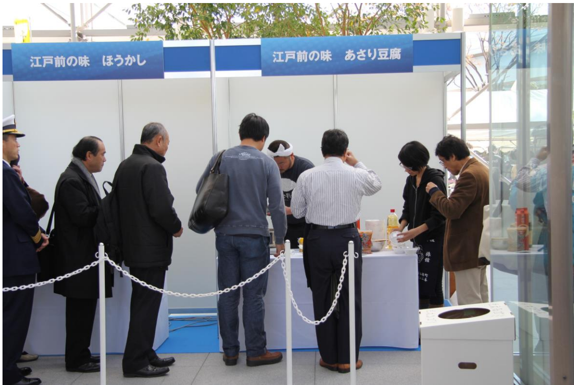
江戸前の味「ほうかし」「あさり豆腐」の試食の列